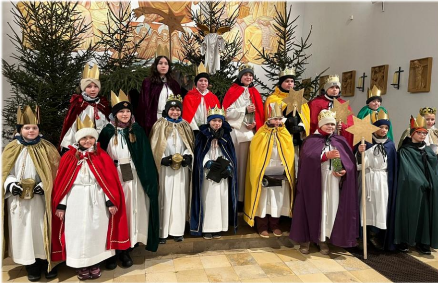
Sternsinger Wiesbaum - Mirbach