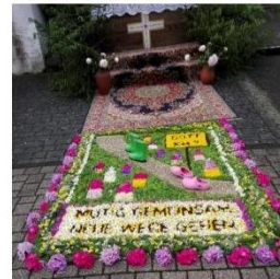
Vier Teppiche in Barweiler