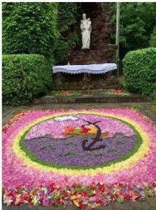
Zwei Teppiche in Adenau