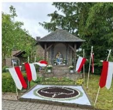
Vier Teppiche in Hümmel