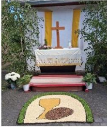
Teppich in Dorsel